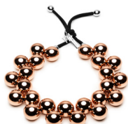
Rose Gold - NKF