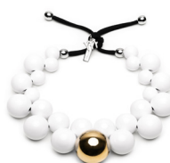
Bianco - Oro