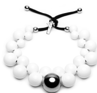
Bianco - Fumè