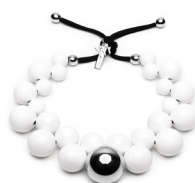
Bianco - Silver