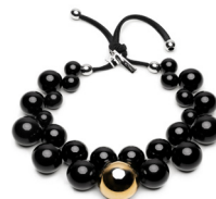
Nero - Oro