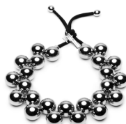
Silver - NKF