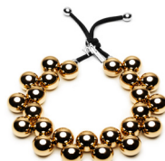
Gold - NKF