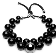
Nero - Fumè