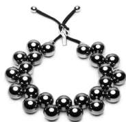
Fumè - NKF